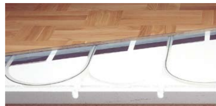
Montuojant sausąją grindų šildymo konstrukciją, šilumą skleidžiantys reflektoriai yra specialioje izoliacinėje plokštėje