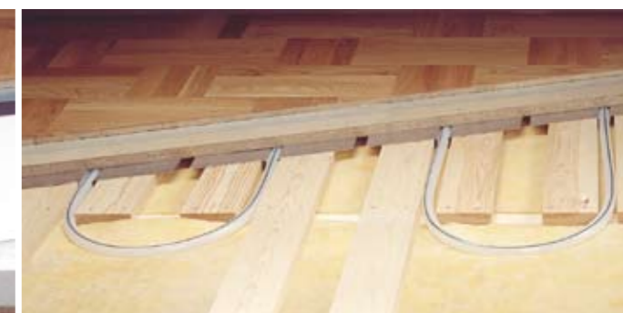
Šilumą skleidžiantys reflektoriai taip pat gali būti montuojami ant medinių tašelių