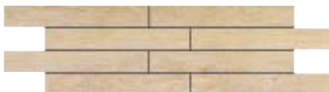
MU.STROBUS 15B 15x50 - 6"x20"